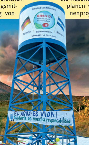
Der von uns mit Hilfe der Bingo-Stiftung errichtete Wasserturm des Dorfes Papalonal bei La Paz Centro und der Vulkan Momotombo beim Ausbruch im Dezember 2015

Trinkwasserprojekten im ländlichen Raum, Trinkwasser an den Schulen, Maßnahmen im Bereich genderspezifischer Kampagnen und aktuell im Rahmen einer kommunalen Klimapartnerschaft zwischen Göttingen und La Paz Centro.